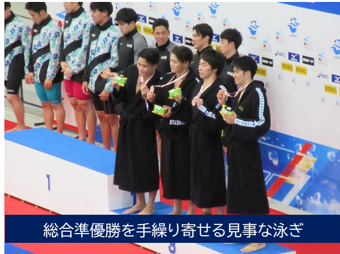
総合準優勝を手繰り寄せる見事な泳ぎ