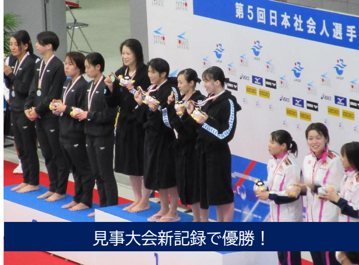
見事大会新記録で優勝!